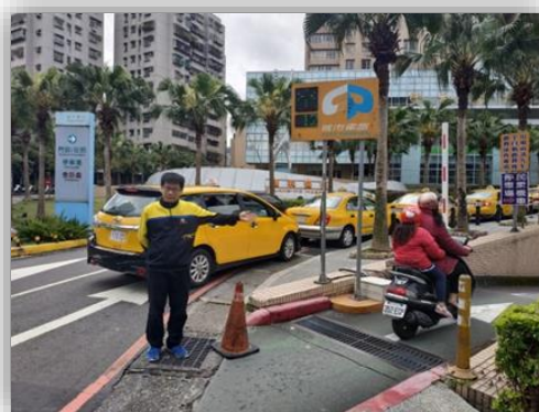
人員於入口處引導