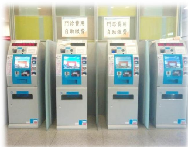
增設自助繳費機及升級系統